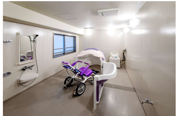
ミスト浴(小規模多機能)