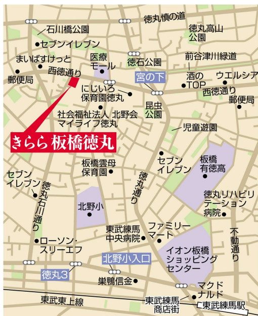
周辺地図(住所:東京都板橋区徳丸3-41-21)

スターツケアサービス株式会社では、 「地域密着のトータルケア体制」(※資料1)の構築を 目指し、ご利用者に応じて必要なサービスを提供し、 地域の方々と連携を図りながら運営をしております。