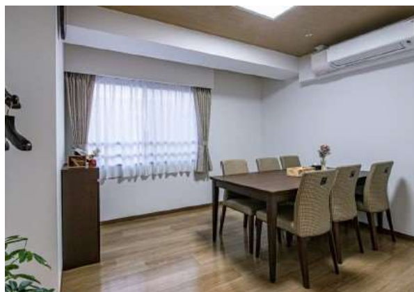
ご家族との歓談に～ファミリールーム