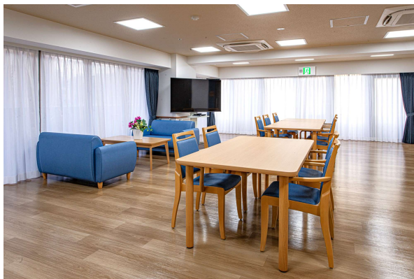
リビングダイニング(グループホーム)

これからも地域密着で、ご利用者やご家族の 皆さまに寄り添い、安心してご利用いただける サービスの提供に努めてまいります。