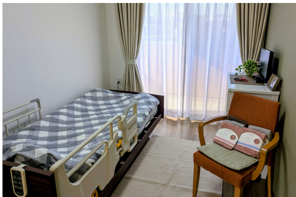
居室(グループホーム)