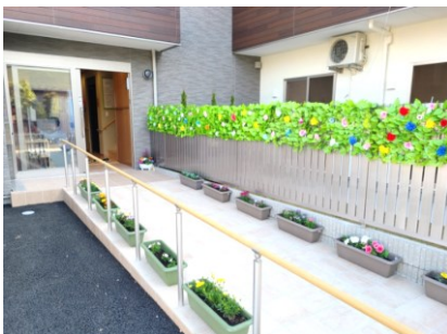
玄関入口スロープ