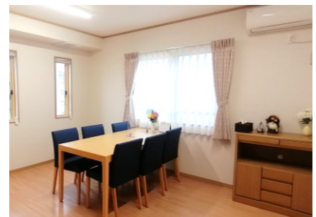
ファミリールーム