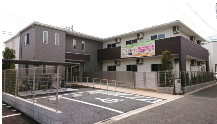
「グループホームきらら千歳船橋」外観

スターツケアサービス株式会社(本社:東京都江東区、代表取締役社長:山崎千里)は、2022年5月1日(日)に『グループホームきらら千歳船橋』を開設しました。本開設により、全国で運営する高齢者支援・介護施設は105事業所、保育施設は13事業所(合計118事業所)、そのうちグループホーム(※1)は51事業所となり、東京都世田谷区内では『グループホームきらら世田谷野沢』、『グループホームきらら奥沢』、『小規模多機能きらら奥沢』に続き4施設目となります。