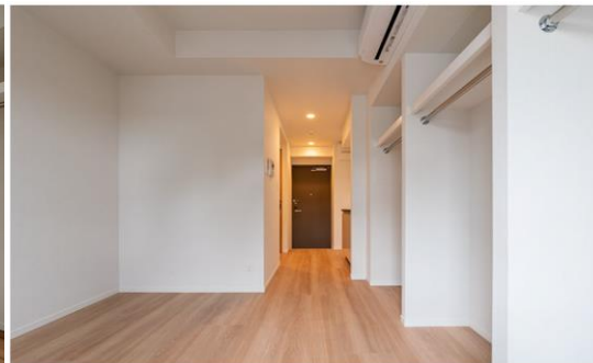
[左・右]居室(入居時には家具・家電が付きます)