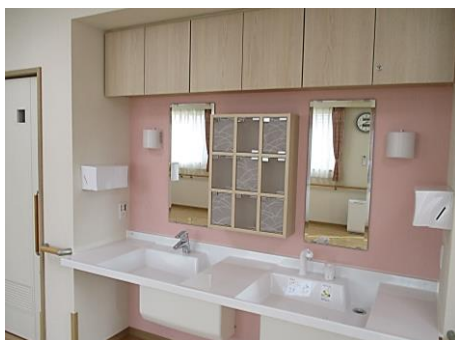
洗面スペース（3階：ピンク）