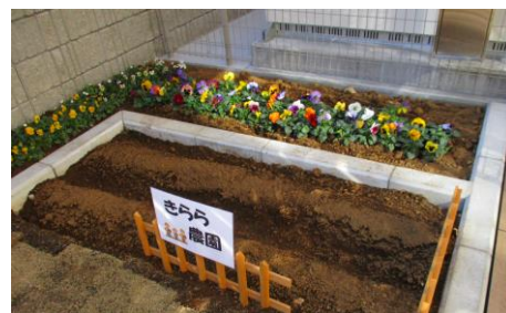
家庭菜園・ガーデニングスペース