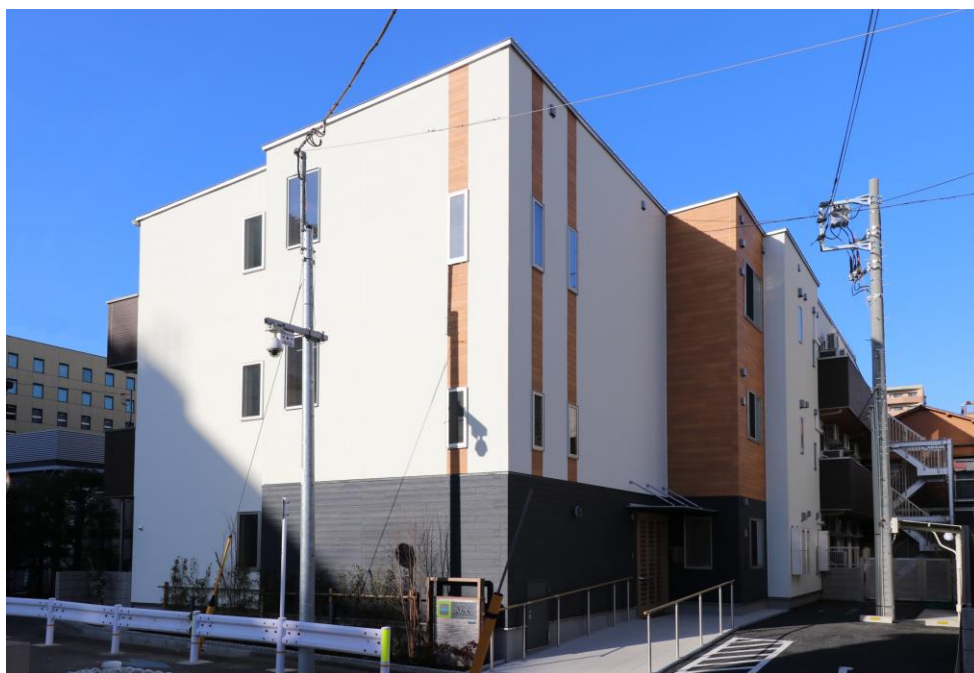
『グループホーム きらら南砂元八幡』外観

ご利用者に安心して暮らしていただけるよう、地域における多事業展開を行うことで、切れ目のない総合福祉サービスの提供を推進するとともに、各高齢者施設と近隣保育園との交流により、事業所や年代を超えた交流を図る“多世代コミュニティの創造”を目指してまいります。(※2)