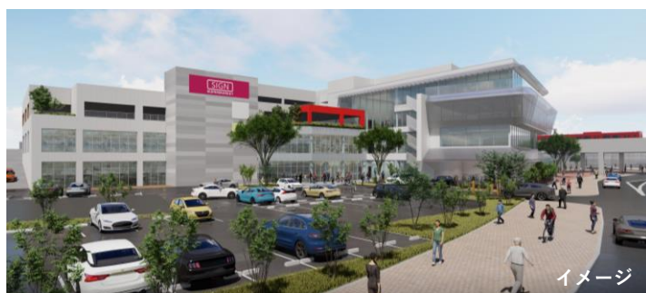
事業敷地北東側より