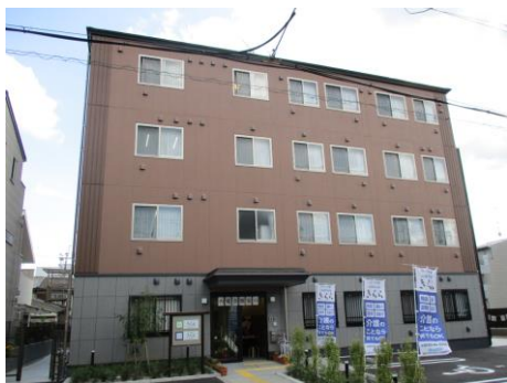
『きらら梅小路』外観

スターツケアサービス株式会社(本社:東京都江東区、代表取締役社長:山崎千里、以下ケアサービス)は、2020年6月1日(月)に『グループホーム きらら梅小路』『小規模多機能 きらら梅小路』を開設します。ケアサービスとして京都府での開設は、グループホームと小規模多機能の複合施設『きらら嵯峨嵐山』に続き2拠点目となり、本施設の開設に伴って運営する高齢者支援・介護・保育の事業所は、全国で108事業所(高齢者支援・介護事業所97事業所、保育事業所11事業所)となります。また本物件の管理は、グループ会社である関西スターツ株式会社(本社:大阪府大阪市、代表取締役社長:澤井良彦)が担います。