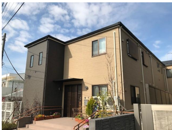
『グループホーム きらら調布』

調布市においてスターツグループでは、土地有効活用のご提案・建設を行うスターツCAM株式会社(本社:東京都中央区、代表取締役社長:直井秀幸)、不動産の管理を行うスターツアメニティー株式会社(本部:千葉県千葉市、代表取締役社長:齋藤 太朗男)、不動産賃貸・売買業務を行う『ピタットハウス』が地域密着でサービスを提供してまいりました。本施設においても施工はスターツCAMが、管理はスターツアメニティーが担い、施工・管理・運営まで、"スターツグループ一体"で取り組みます。