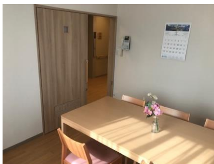
ファミリールーム