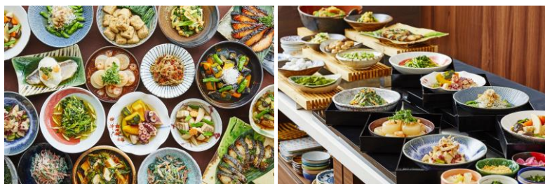
日替わりで楽しめる「手作りおばんざい」