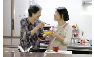
訪問介護事業ではホームヘルパーがご自宅にお伺いして、ケアプランに基づいて食事・排泄・入浴・更衣介助などの身体介護サービスや生活援助サービスをご提供します。