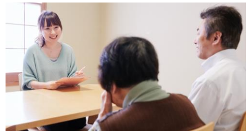
居宅介護支援事業ではケアマネジャーが介護認定や更新手続きの申請代行、ケアプランの作成、及び介護サービスの提供支援や内容の確認を行っています。