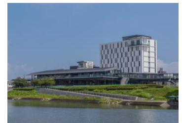
「OTO RIVERSIDE TERRACE」外観

【店 舗 名】ピタットハウス東岡崎店 【所 在 地】愛知県岡崎市上明大寺町二丁目14-1 OTO RIVERSIDE TERRACE 北店舗棟3階 名鉄名古屋本線「東岡崎」駅にデッキで直結