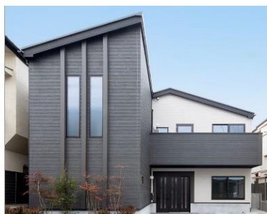
『グループホームきらら 新高円寺』

またスタートグループでは、京都市中央卸売市場第一市場「賑わいゾーン」活用事業（※）の開発に携わるなど、地域の皆さまに、幅広いサービスの提供を目指しています。※京都の「食」と「職」をテーマとした商業施設とホテルを組み合わせた2020年開業予定の複合施設