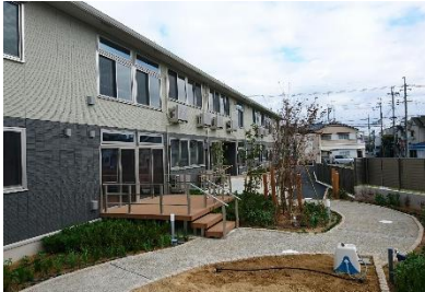
ウッドデッキ・遊歩道・菜園