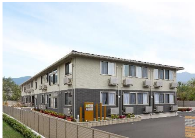
『グループホーム・小規模多機能 きらら嵯峨嵐山』

スターツケアサービス株式会社（本社：東京都江東区、代表取締役社長：山崎千里）は、3月1日に京都市右京区に『グループホーム・小規模多機能きらら嵯峨嵐山』と、東京都杉並区に『グループホームきらら新高円寺』を開設します。本開設に伴いスタートケアサービス株式会社が運営する介護・保育の福祉施設は 100事業所 となります。