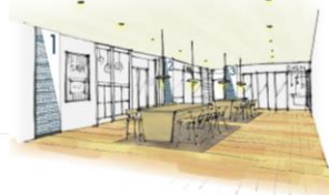
【3階スクールゾーンイメージイラスト】