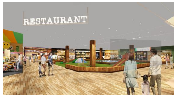
【3階レストランゾーンイメージパース】