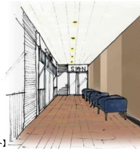
【3階クリニックゾーンイメージイラスト】