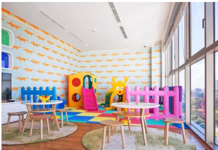
キッズスペース(18階) 7:00～19:00