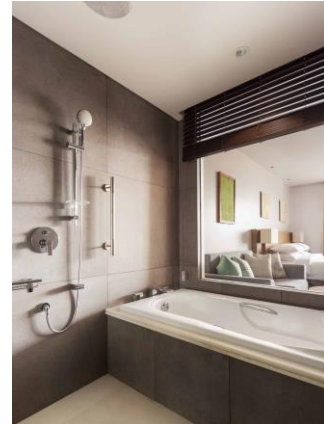
洗い場付きバスルーム