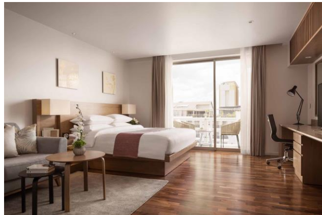
1ベッドルーム(ベッドルーム)