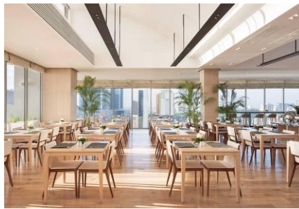
朝食レストラン(18階) 6:00～10:00(最終入店9:30)