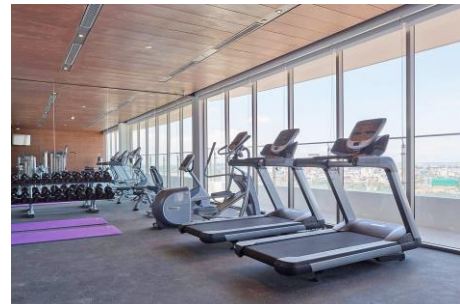
フィットネスジム(18階) 6:00～22:00