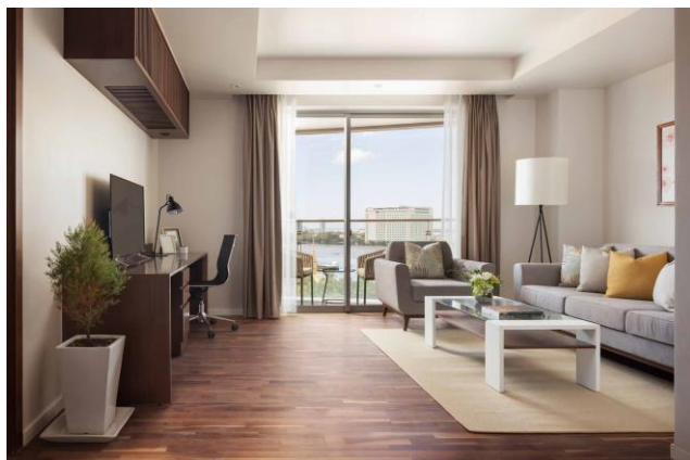
1ベッドルーム(リビングルーム)