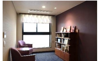
多目的なアルコーブを19カ所配置