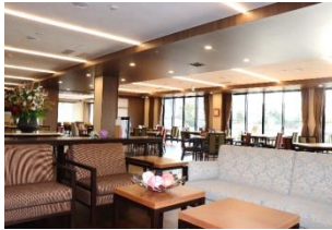
華やかなダイニングレストラン