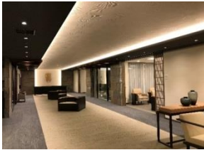
和モダンな雰囲気のエントランス