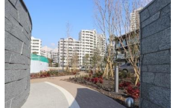
車いすでも周遊できる遊歩道