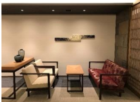
フロア毎にコンセプトを持たせた各フロアのリビング 1階：『華』 2階：『水』 3階：『風』