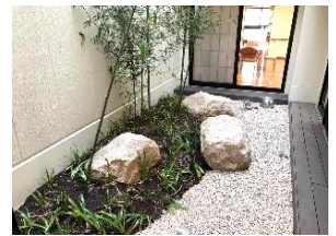
和風情緒ある坪庭