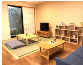
畳スペースのあるリビング一部