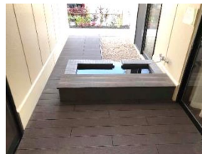
デイサービス利用者と交流できる足湯