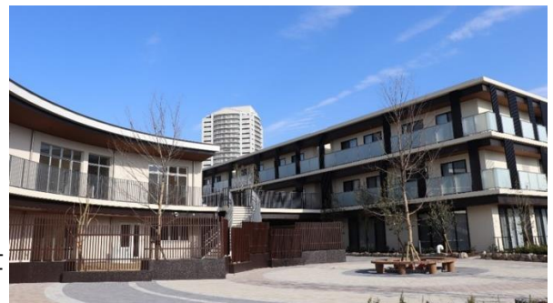
「スタートコミュニティケアセンター新浦安」 外観 保育棟(左)と介護棟(右)をデッキでつなぎ交流を図ります

地域密着の理念に基づき“0歳から100歳まで”世代を越えて、人と人のつながりに喜びを感じられるコミュニティ創出を目指し、多世代が交流できる環境を提供します。