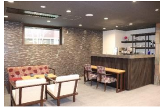
お酒好きの方がくつろげるバーラウンジ