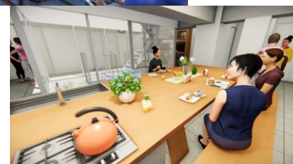
シェアダイニング

(認可保育所) 開所日:2019年4月(予定) 運営事業者:株式会社日本保育サービス (共同住宅・シェアハウス) 入居開始:2019年2月(予定)