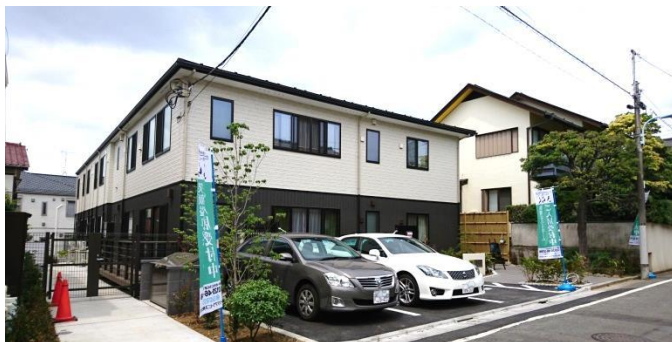
駐車場は3台分完備で、ご家族も訪問しやすい環境を整備

慣れ親しんだ地域でその人らしく暮らしながら、必要とされるサービスが受けられる地域密着によるトータルケアの体制を目指し、利用者様に安心して暮らしていただけるよう、地域密着の総合福祉サービスの展開を進めて参ります。