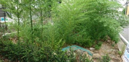
花壇や竹林のある庭園