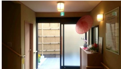
和の装飾がほどこされた玄関