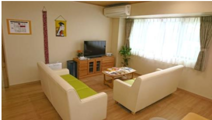
ゆったりとくつろげるリビング