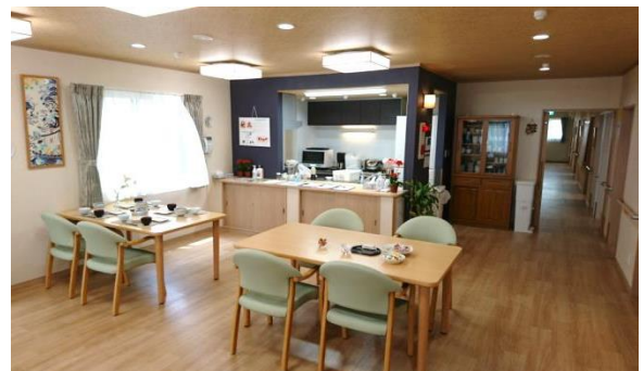
心地よい陽光が差し込む、ダイニングとキッチン