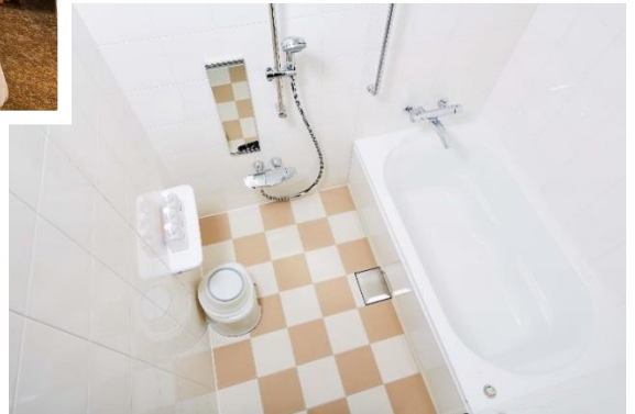
洗い場付きバスルーム