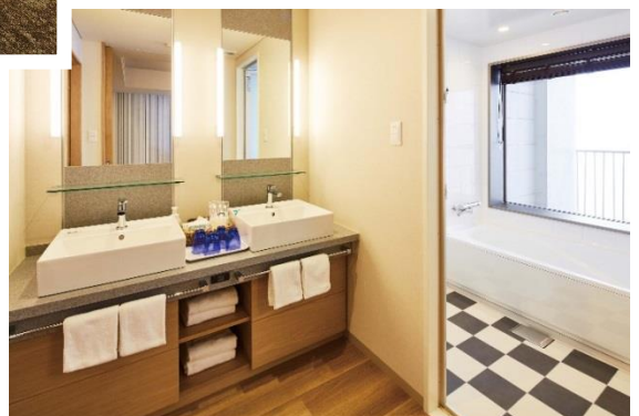
ダブルシンク(洗面台) 洗い場付きバスルーム