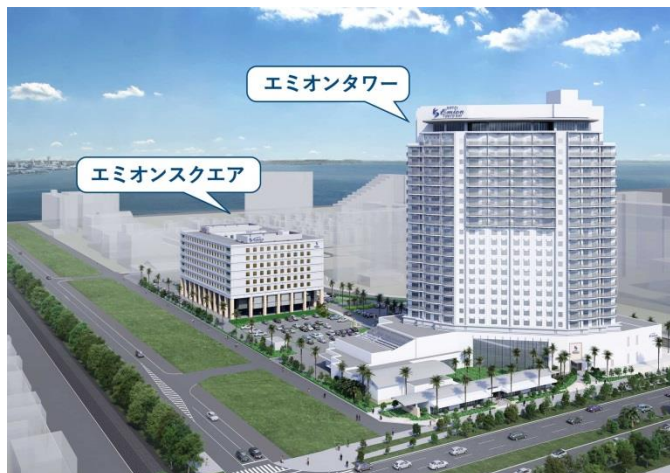
「ホテル エミオン 東京ベイ」全景パース