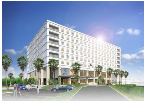
<<ホテル エミオン 東京ベイ>>