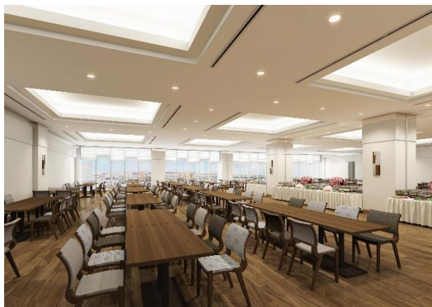
2階 朝食会場：スクエアホール（最大320席）