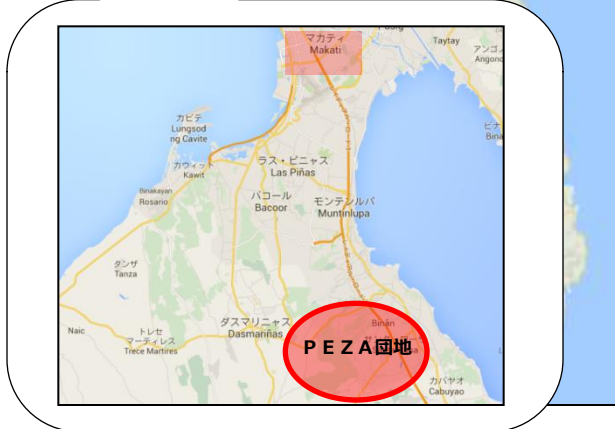
グリーン フィールド オートパーク