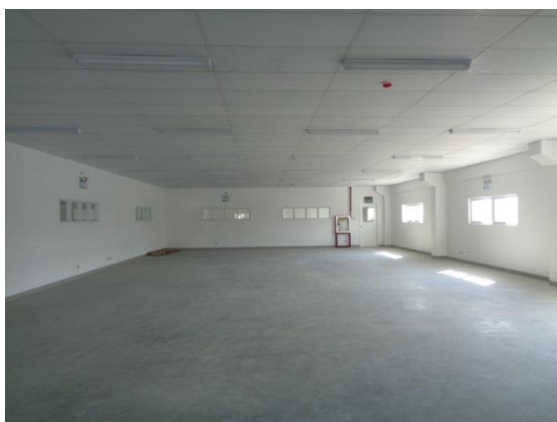
■ 内部は1,000m前後で7つまで区画分けが可能。事務所として使用できる2階も完備。