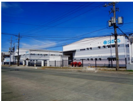
■ 2棟建てになっており、敷地総面積は約1ha