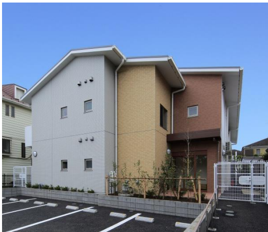
閑静な住宅街になじむモダンな施設外観

スタートケアサービス株式会社では、今年度中にグループホーム2施設『きららあま七宝町』（愛知県あま市）・『きらら南巽』（大阪府大阪市）の開設を予定しております。各エリアにおいてご利用者様の心身の状態に合わせた介護サービスを提供。慣れ親しんだ地域から離れることなく、その人らしく暮らしながら、必要とされるサービスが受けられる地域密着によるトータルケア体制を目指し、ご利用者様に安心して暮らして頂けるよう、地域密着の介護サービスの展開を進めて参ります。