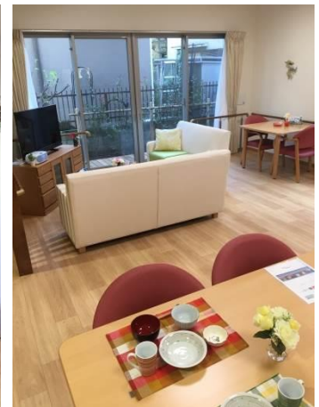
日当たりの良いリビング