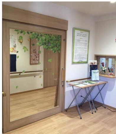
解放感のあるガラス扉の出入口