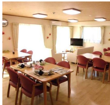
光の差し込む明るいリビング