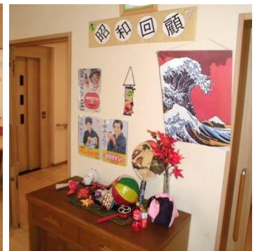
「和」がテーマのインテリア