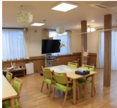
光の差し込む明るいリビング