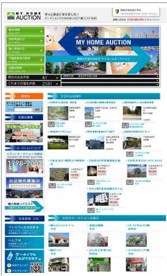
「マイホームオークション」のTOP画面

不動産オークションの落札件数は、「ピタットオークション」がYahoo!オークション内で運営を開始した2007年7月は19件でした。その落札件数も2009年3月には80件と着実に伸びております。この度、不動産オークションの名称を「マイホームオークション」に変更し、Yahoo!不動産と連携を図りながら、より「透明」「公正」「安心」な不動産取引市場の構築を目指してまいります。