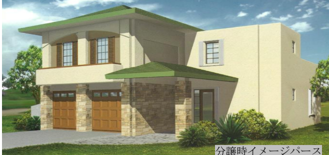
分譲時イメージパース

実質利回り 3.71% (年間賃料-年間共益費-年間管理料*) / 価格 * 月管理料は賃料の10%でスタートツグアム リアリティーに委託した場合があります 固定資産税等 (別途) は含まれていません。