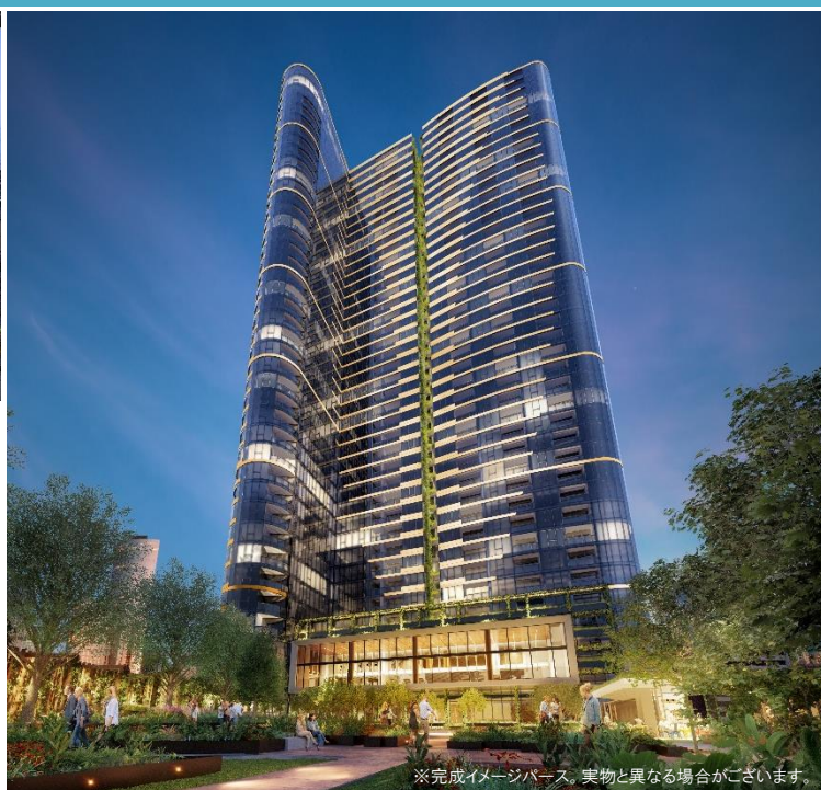
※完成イメージベース。実物と異なる場合がございます。

世界で1番住みやすい都市に、7年連続で選ばれているメルボルン (※1) 。住宅ニーズが高まる同地の中心部に地上44階建て、総戸数719戸の大型タワーマンション開発事業 Melbourne Quarter East Towerがスタート(2020年竣工予定 ※2 )。本物件は、三菱地所グループとしてはオーストラリアで初の住宅事業。スタートは三菱地所グループと販売協定を結び、日本人向けの販売を行っております。価格は1BED(54㎡)約4,200万円(AUD 470,000)～ (※3) 。不動産購入トータルサポートとして、オーストラリア不動産投資に精通した弁護士・会計士の方々にもご講演いただきます。