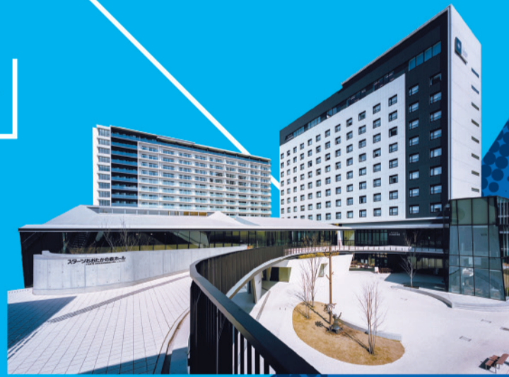
流山おおたかの森駅前市有地活用事業