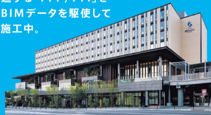
京都市中央卸売市場第一市場「賑わいゾーン」活用事業

内閣府が推進する「PPP/PFI」を 免震技術やBIMデータを駆使して 全国各地で施工中。