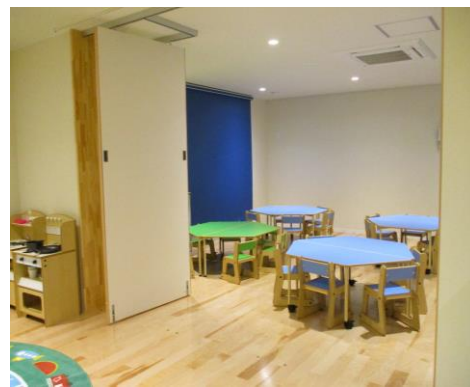
可動式パーティションで保育室の柔軟な環境設定が可能