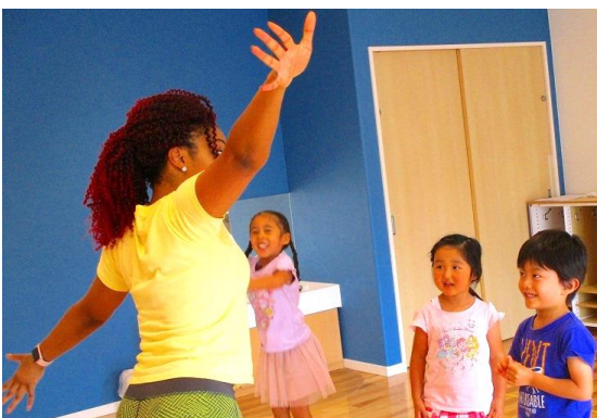
当社の保育園で実施したダンスと英会話を組み合わせたプログラム