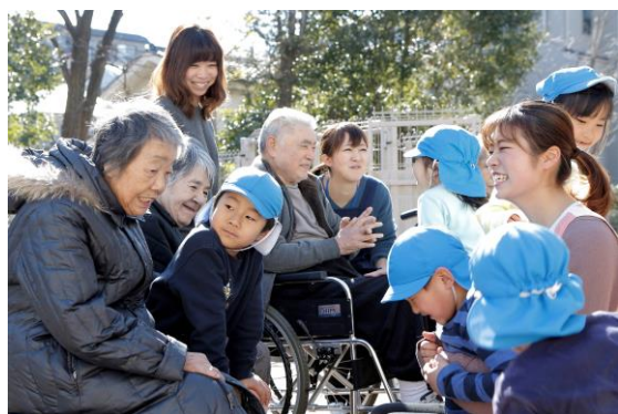
ケアサービスが運営する施設での幼老交流の様子

本開設に伴い、ケアサービスが運営する高齢者支援・介護・保育の事業所は、全国で106事業所(高齢者支援・介護事業所95事業所、保育事業所11事業所)となります。