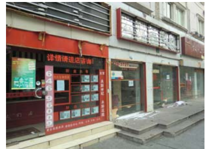
閉店する不動産店舗も多い

◆10月の中古住宅市場も低迷（11月11日付 新聞晨报） 「金九・銀十」と言われ、中国不動産市場では1年間で9月が最も売れ行きがよく、10月が二番目に良いとされてきました。しかし今年9月は惨憺たる結果であったのに引き続き、10月の上海市中古住宅売買市場は昨年同期比21.47%マイナスの8,100件の取引件数となりました（信義房屋提供の資料による）。この数字は過去5年間で2008年10月の6,600件に続く二番目の低水準です。市内で多くの店舗を構える中原地产のある支店では、来店客が9月より30%減となったところもあるとのこと。