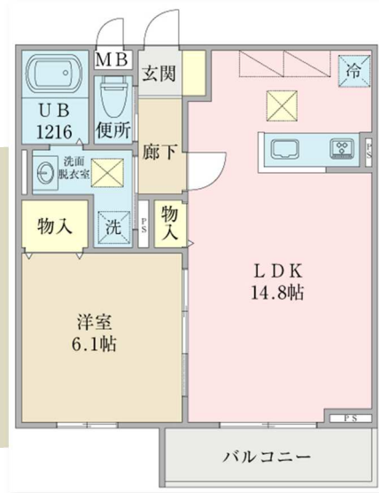
3号・5号室 (反転) 46.92㎡