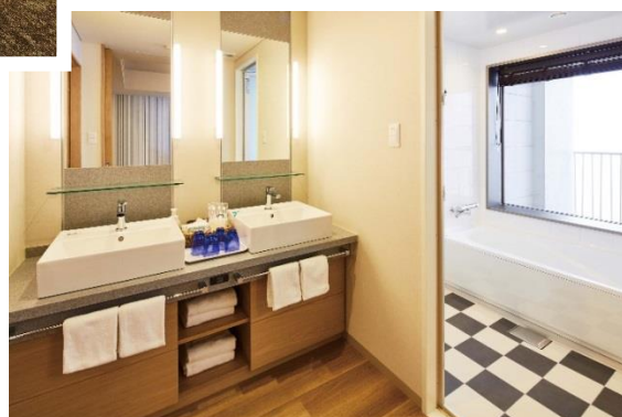
ダブルシンク(洗面台) 洗い場付きバスルーム(ビューバス)